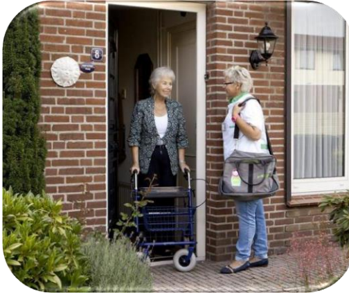
Zorgmedewerker bezoekt cliënt n.a.v. een alert van eesyhome