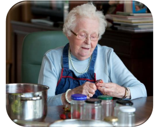
Activiteit (koken) die zowel energie als water verbruikt

Middels het monitoren van het water- en energieverbruik van (semi)zelfstandig wonende ouderen worden leefpatronen vastgesteld. Indien er afwijkingen zijn in het leefpatroon, kunnen deze gegevens een belangrijke indicatie zijn voor extra ondersteuning van preventieve of acute aard en ontvangen zorgmedewerkers een alert van het monitoringssysteem. Hiermee kunnen cliënten gezonder en langer zelfstandig wonen met een veilig gevoel, kunnen (thuis)zorgmedewerkers slimmer ingezet worden en levert dit een besparing aan zorgkosten op. Ook kan het energieverbruik verminderd worden en worden extra kosten voorkomen.